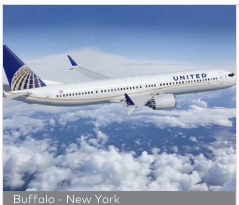
Buffalo - New York