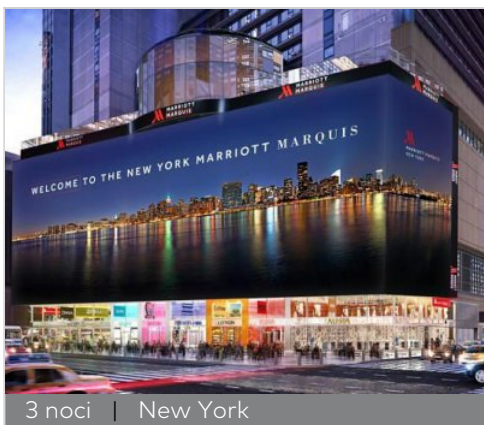
3 noci | New York