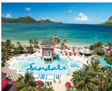
5 nocí | Svätá Lucia