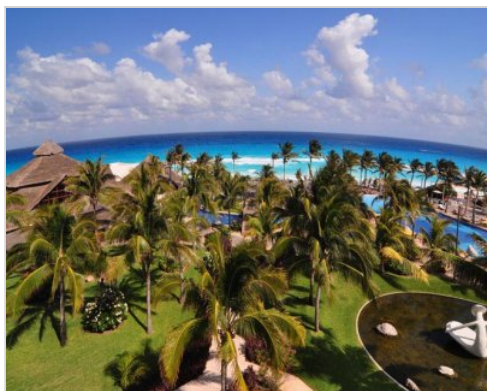
4 noci | Playa del Carmen-Cancún