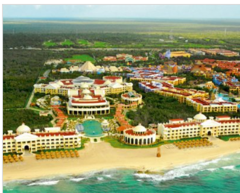
4 noci | Playa del Carmen-Cancún