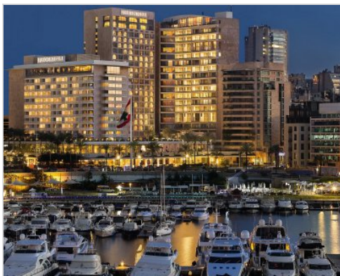
2 noci | Bejrút