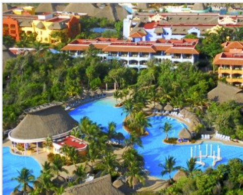
5 nocí |