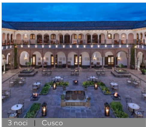
3 noci | Cusco