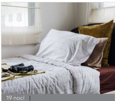
19 nocí |