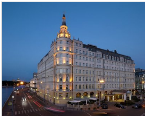
5 nocí | Moskva-Petrohrad