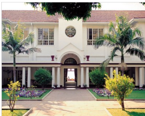
2 noci | Victoria Falls