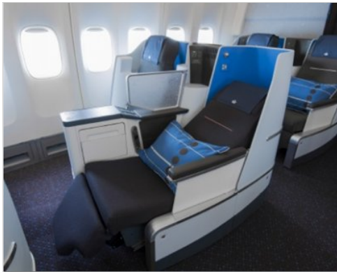
Lietadlo Air France/KLM