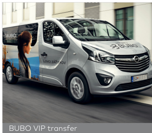
BUBO VIP transfer