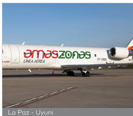
La Paz - Uyuni