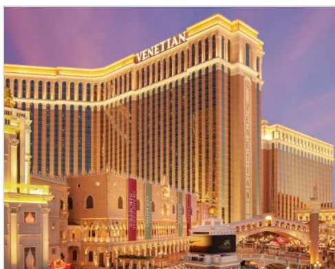
7 nocí | USA