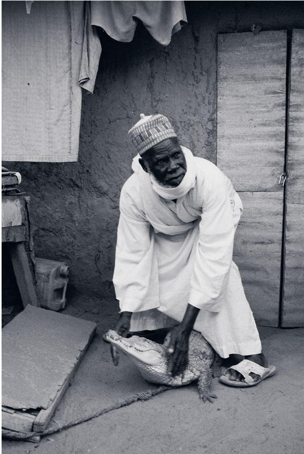
KROKODÍL NAMIESTO PSA